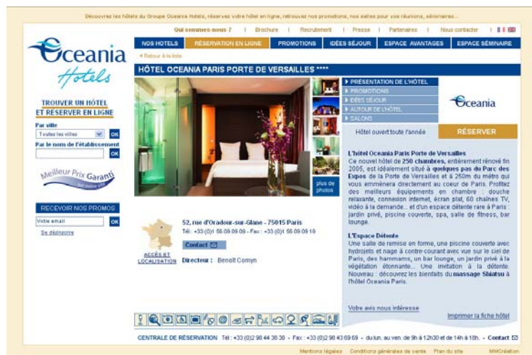
Fiche hôtel de l'Oceania Paris Porte de Versailles ****

ville bien sûr, mais aussi par la capacité d'accueil des salons ou d'hébergement de l'hôtel. En bref, oceaniahotels.com est un concentré d'informations et d'outils pratiques pour